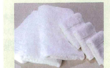
【バスタオル・フェイスタオル】