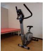
マグネットバイク