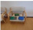
筋カトレーニング (重錘バンド)