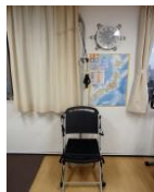
レジスタンス チェア