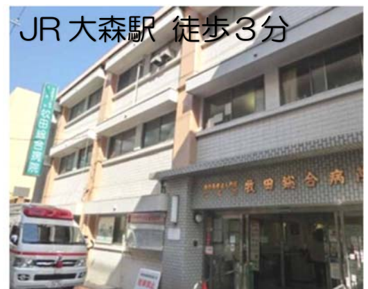
〈大森〉牧田総合病院