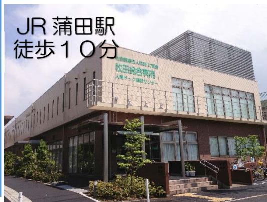
〈蒲田〉人間ドック健診クリニック